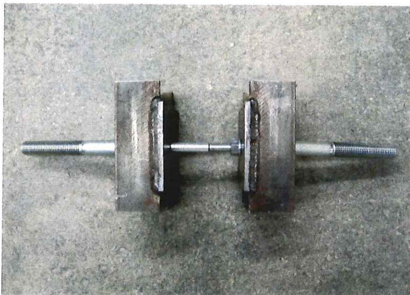
写真-1 試験体の外観